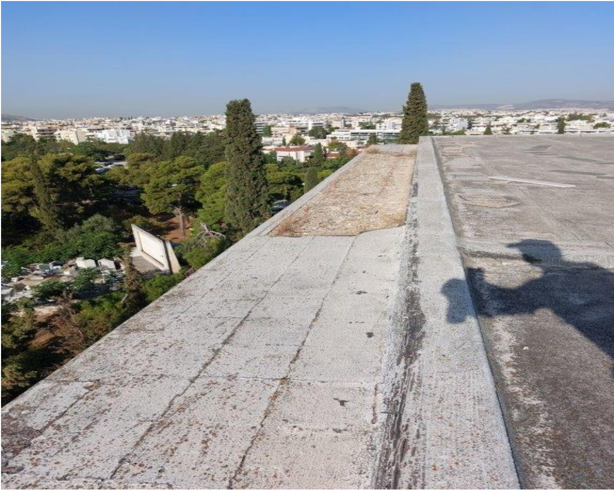
Εικόνα αποξηλωμένου Δώματος από τα πλακίδια