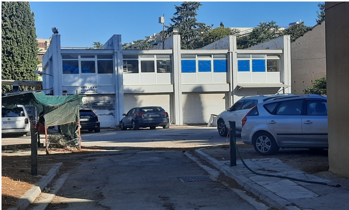
Εικόνα 1. Κτίριο που στεγάζει το Αρχείο