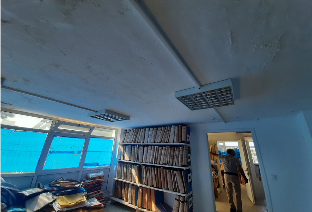
Εικόνα 3. Υγρασία στο Δώμα του Αρχείου