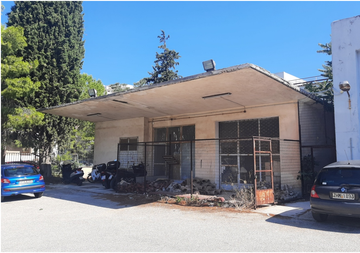
Εικόνα 5 . Κτίριο Υποσταθμός- Αποθήκες