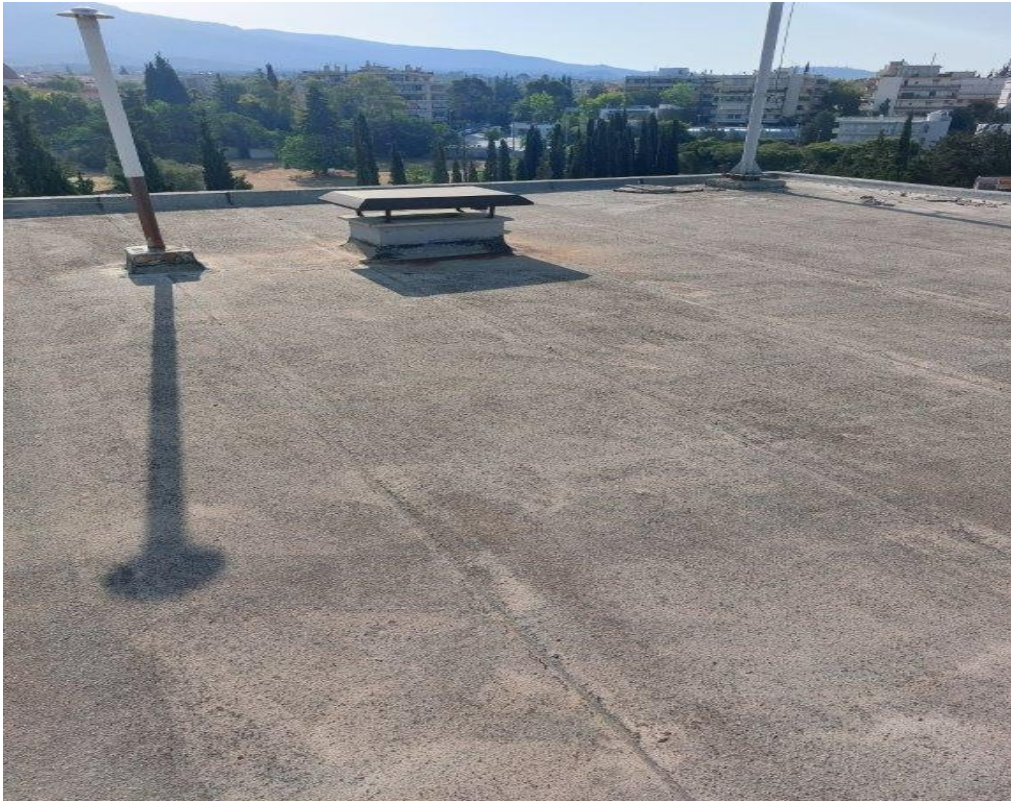
Εικόνα του ενός καπακιού που θα αντικατασταθεί